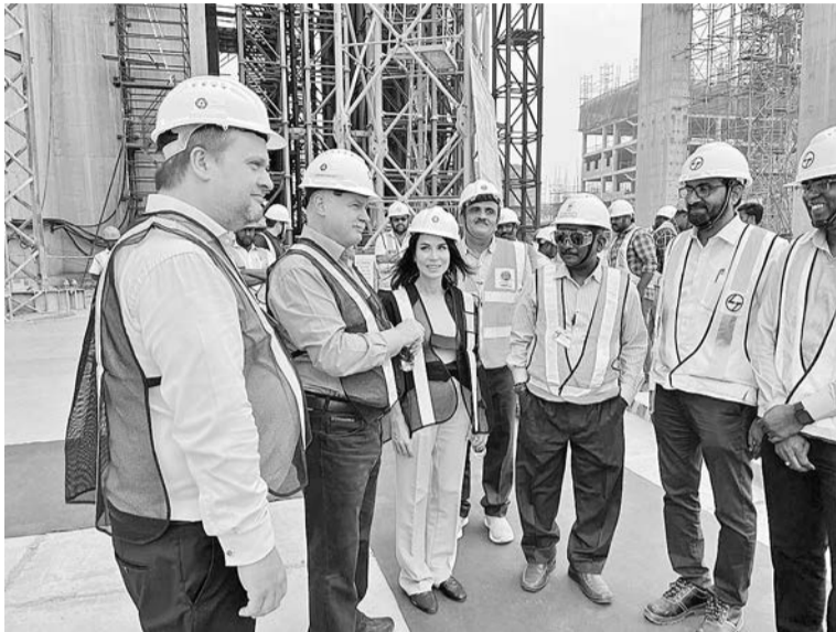
Представители семи новгородских предприятий нашли партнёров в республике, а НовГУ оформил намерение о сотрудничестве с университетом в штате Керала.